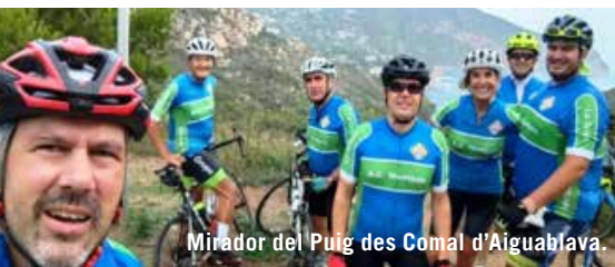
Mirador del Puig des Comal d'Aiguablava.

El santuari de la Mare de Déu dels Àngels està situat a l'Alt dels Àngels, a 481 metres d'altitud, al massís de les Gavarres. Des d'aquest cim es veu una panoràmica extraordinària del pla de Girona, Baix Empordà, illes Medes, Pirineus, Montseny i les Guilleries. És probablement la pujada més freqüentada pels cicloturistes i ciclistes professionals de la zona, entre ells, Lance Armstrong en les temporades en que es va instal·lar a Girona.