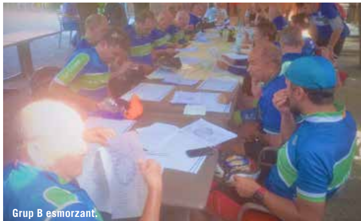
Grup B esmorzant.

ANADA: St Adrià de Besòs (RG), Mataró (RG), Arenys de Mar, Canet de Mar. TORNADA: Arenys de Mar, Mataró (RG), Montgat (RG), Barcelona. SORTIDA: A les 8:00 de Plaça Espanya 95 kms Desnivell: 500 mts Index duresa IBP: 42.