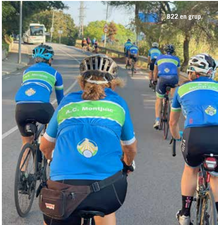
B22 en grup.

Esmorzar de club de final de temporada d'estiu Sortida a les 8:00 de Plaça Espanya.