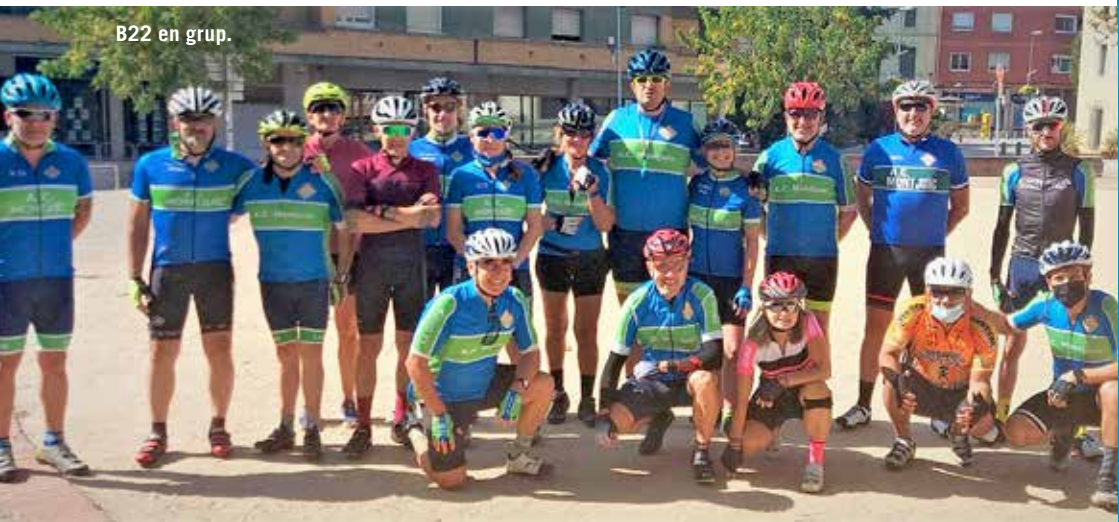
B22 en grup.

SORTIDA: A les 8:00 de Plaça Espanya 75 kms