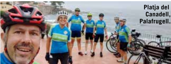
Platja del Canadell, Palafrugell.

la pujada al Far de Sant Sebastià, pujada curteta però amb rampes del 10, 12 i fins del 14% en algun punt que ja ens van deixar marejats a alguns però, com ens anaven prevenint qui coneixien la ruta, la primera d'unes quantes que encara havien d'arribar. Des de dalt, tot i que encara estava bastant ennuvolat, vam poder veure les vistes sobre Calella i Llafranc.