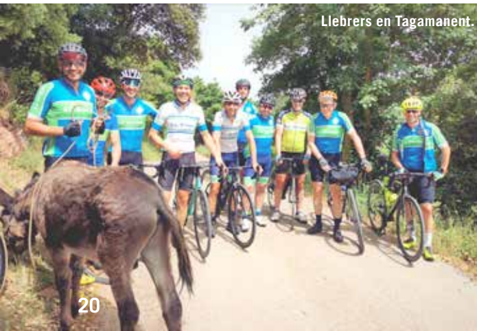
Llebrers en Tagamanent.

Sortida a les 8:00 Barcelona, 9:00 Sant Feliu de Llobregat, 50 km.