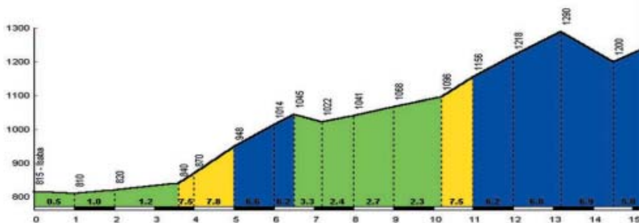
Zurisa, da Isaba

Pensant que ja hem fet el més dur (com diu l'organització) baixem un port complicadot pel delicat estat de l'asfalt, planejem uns pocs quilòmetres, i ja ens trobem apunt de pujar l'alt de Zurisa. Aquest port comença suau però uns kilòmetre i mig amb rampes entre un 7% i un 8% va recordar a les nostres cames que ja estem força tocats, sort que 1,5 kilòmetres més tard tenim un descans d'entre 3 i 4 kilòmetres, però no es més que un miratge ja que ens queden 3 kilòmetres més entre el 6% i el 8% per coronar l'alt. La calor torna a fer estralls i l'arribada al port sembla inabastable, sort de la nombrosa gent animant (un cop més) ja que realment aquest punt va ser força crític. Un cop amunt vam tenir un petit avituallament que sol va tenir aigua (absolutament insuficient per l'estat en el qual arribava la gent) i personalment va ser quan vaig veure la primera persona sollicitar abandonar la marxa.