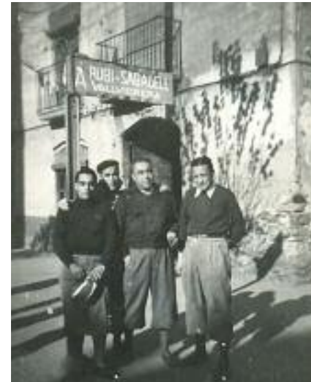
Febrer de 1946. Directius de la A.C. Montjuïc de Gràcia, la Unió Esportiva de Sants, l'Agrupació Velocipèdica Hostafrancs, el Club Ciclista Collblanc, la Unió Ciclista L'Hospitalet, el Sant Martí, el Barceloneta, el Poble Nou, l'Esport Ciclista Barcelona, el Poble Sec, el Sants "petit", l'Aurora, el Cornellà, el Club Ciclista Bètulo, el Mataró, el Granollers, el Sabadell, el Terrassa, el Manresa, l'Olesa, el Martorell, el Vilafranca, el Mollet, el Montcada, el Club Ciclista Sarrià, la Unió Esportiva Les Corts, el Sant Feliu, l'Agrupació Ciclista Sant Just, el Sant Boi, el Sant Joan Despí, el Club Ciclista El Prat, el Maricel de Sitges, el Vilanova, el Vendrell, el Club Ciclista d'Horta, el Club Ciclista Provençalenc, el Club Ciclista Molins de Rei, etc. (Demano ara perdó perquè em consta que n'hi havia d'altres entitats, de les quals no recordo el nom).

de Gràcia, la Unió Esportiva de Sants, l'Agrupació Velocipèdica Hostafrancs, el Club Ciclista Collblanc, la Unió Ciclista L'Hospitalet, el Sant Martí, el Barceloneta, el Poble Nou, l'Esport Ciclista Barcelona, el Poble Sec, el Sants "petit", l'Aurora, el Cornellà, el Club Ciclista Bètulo, el Mataró, el Granollers, el Sabadell, el Terrassa, el Manresa, l'Olesa, el Martorell, el Vilafranca, el Mollet, el Montcada, el Club Ciclista Sarrià, la Unió Esportiva Les Corts, el Sant Feliu, l'Agrupació Ciclista Sant Just, el Sant Boi, el Sant Joan Despí, el Club Ciclista El Prat, el Maricel de Sitges, el Vilanova, el Vendrell, el Club Ciclista d'Horta, el Club Ciclista Provençalenc, el Club Ciclista Molins de Rei, etc. (Demano ara perdó perquè em consta que n'hi havia d'altres entitats, de les quals no recordo el nom).