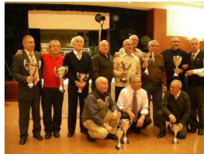
Campeons dels diferents grups

El lloc, el restaurant "Los Tres Molinos", com l'any passat. Qüestions pràctiques: segons el parer general, el sopar va ser equilibrat i encertat, just pel preu que s'havia pagat, i l'estoneta de ball suficient per tal de que els més agosarats lluïssint les seves habilitats (es nota que el personal més