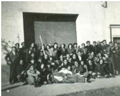
Febrer de 1946. Socis i amics de la Grupa en el dia del meu homenatge de despedida cap a la "mili"

Fa molts anys, a Barcelona i rodalies hi convivia un munt d'entitats ciclistes, i quan es feia la Festa del Pedal, una llarga caravana de grups ciclistes amb el seu corresponent banderí al capdavant sortia de l'Arc del Triomf i es dirigien al lloc o població que els havien estat assignats (que moltes vegades es sol·licitava a la Federació Catalana fins i tot amb un any d'antelació).