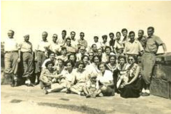
10/9/50. Excursió de la A. C. Montjuïc a casa en la despedida de solter

Actualment, les sortides de la Grupa (i d'altres entitats) es fan per grups, en el nostre cas Llebrers, Rodadors, A, B i C. Aquell modest entrepà de xoriç o truita, tot i que es manté en ocasions, en d'altres ha deixat pas a les clàssiques mongetes amb botifarra i altres especialitats gastronòmiques. En qualsevol cas, no cal preocupar-se pel dopatge, perquè em sembla que cap d'aquestes "substàncies" donaria positiu en un control.