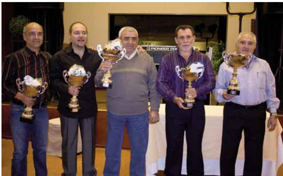
Campeones de los diferentes grupos