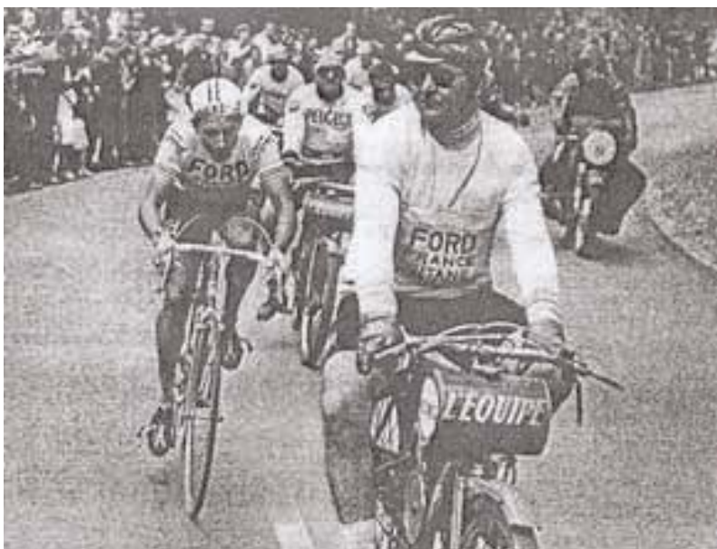
Jacques Anquetil - 1965

Para finalizar no podemos olvidar una de las mas grandes gestas lograda por un ciclista en los tiempos modernos. Fue el gran JACQUES ANQUETIL que en 1965 ganó la BURDEOS-PARIS al día siguiente de haber logrado una victoria duramente disputada en la carrera por etapas de la DAUPHINE LIBERE. El maestro de la lucha en solitario y primer corredor que lograba cinco triunfos en el TOUR, demostró cuan gran campeón era en 1965, nadie había logrado jamás algo parecido y es posible de que nadie lo vuelva a repetir. ANQUETIL concluyó victorioso la DAUPHINE LIBERE y seguidamente, sin ningún descanso, lo trasladaron en automóvil a la lejana BURDEOS para tomar parte en la dura carrera que aquel año era «tan solo» de 557 kms. Tras varias horas de viaje tan solo pudo descansar en BURDEOS durante unas tres o cuatro horas y a las dos de la madrugada tomó la salida en la mas larga carrera ciclista que por aquel entonces se corría.